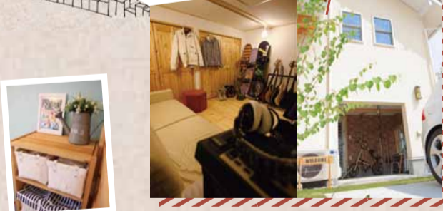
ホビー＆ガレージスペース

趣味や遊びのために使える大きな空間。もちろん収納のためのスペースとしても大活躍。家事も育児も、趣味もおおいに楽しみましょう。