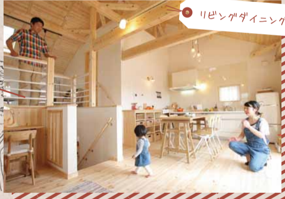
リビングダイニング

リビングを見わたせるキッチン。造作家具で収納もたっぷり。楽しくお料理できます。子どもたちも進んでお手伝いしてくれそう!